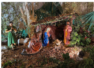
La Crèche de Saint Laud 2023

Selon la tradition, Saint-François d'Assise aurait été le premier à mettre en place une crèche vivante dans le village de Greccio, en Italie, en 1223. A la fin du XVI e siècle, les Jésuites multiplient dans toute la chrétienté les crèches en modèle réduit telles que nous les connaissons aujourd'hui pour servir de catéchèse. Dans sa Lettre apostolique Admirabile Signum, le Pape François conclut : "la crèche fait partie du processus doux et exigeant de la transmission de la foi. Dès l'enfance et ensuite à chaque âge de la vie, elle nous apprend à contempler Jésus, à ressentir l'amour de Dieu pour nous, à vivre et à croire que Dieu est avec nous et que nous sommes avec lui, tous fils et frères grâce à cet Enfant qui est Fils de Dieu et de la Vierge Marie, et à éprouver en cela le bonheur. A l'école de saint François, ouvrons notre cœur à cette grâce simple et laissons surgir de l'émerveillement une humble prière : notre "merci" à Dieu qui a voulu tout partager avec nous afin de ne jamais nous laisser seuls." ( Pour lire toute la lettre : https://www.vatican.va/content/francesco/fr/apost_letters/documents/papa-francesco-lettera-ap_20191201_admirabile-signum.html )